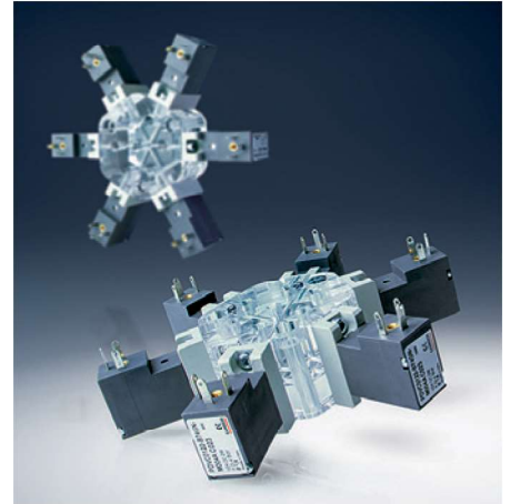
Soluzioni customizzate per qualsiasi esigenza. Tailor-made solutions for any application.