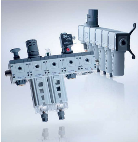
Gamma FRL corredata di accessori. FRL range equipped with accessories.