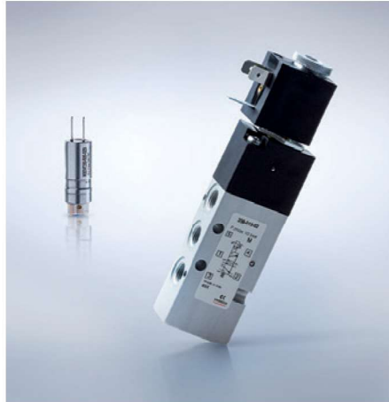
Valvole e elettrovalvole. Valves and solenoid valves.