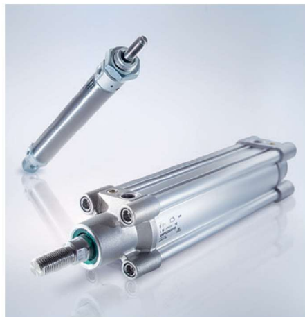
Attuatori a norma ISO e non normalizzati. ISO and non-standardised actuators.