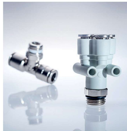
Raccordi in varie forme e configurazioni. Fittings with a wide variety in shapes and configurations.