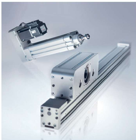
Soluzioni per l'automazione elettrica. Solutions for electrical automation.